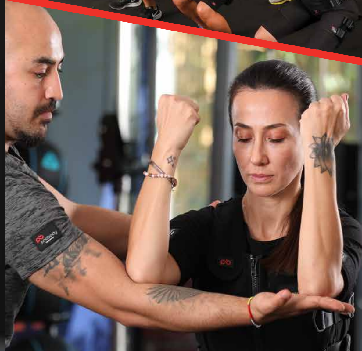
• BİREBİR ANTRENMAN