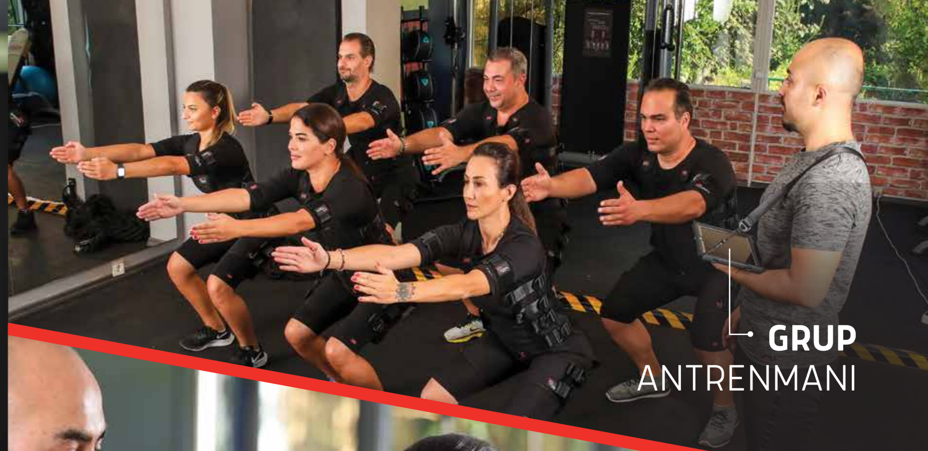
• GRUP ANTRENMANI